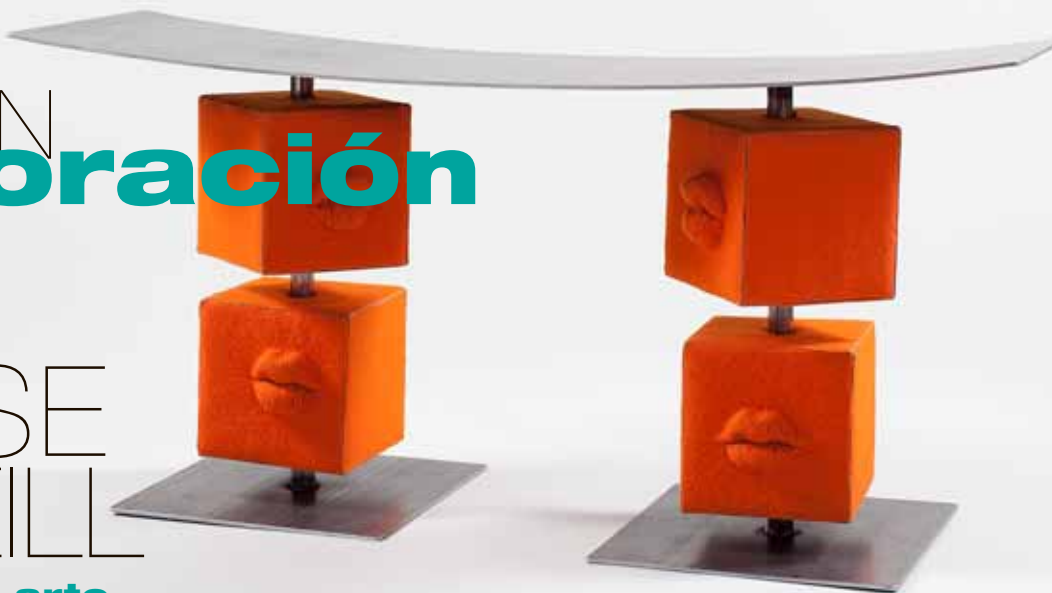
Patas de fieltro en sus mesas de hierro.